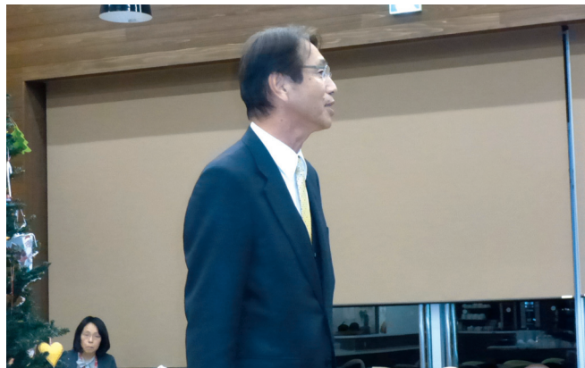
L C 西野会長挨拶