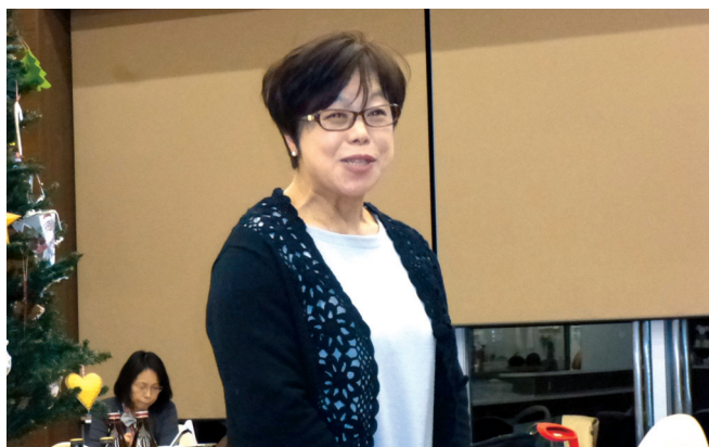
道の駅 植田駅長挨拶