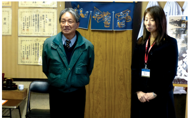
岡部社長より締め挨拶