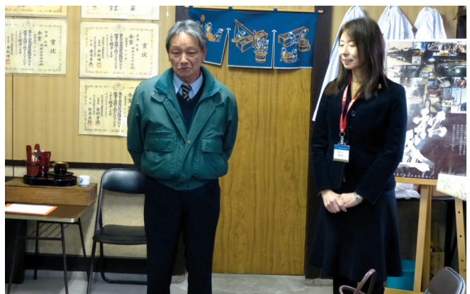
草野会長より御礼のことば