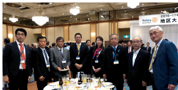
参加者の皆さん